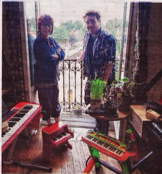
Miss Ash et Zefix préparent le Tour du Rond-point avec des instruments de musique « jouets ».

Les artistes ont prévu de s'installer sur la partie centrale et d'y jouer de leurs ins-