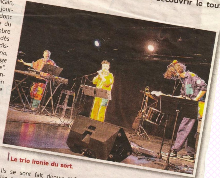
Le trio Ironie du sort.

Ironie du sort a vu le jour en 2021, lauréat du tremplin musique actuelle "Les Éclats" en 2021 à Reyrieux (01).